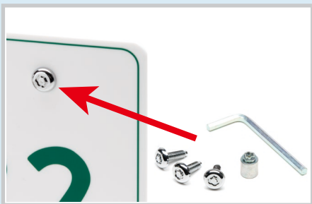
ナンバープレートロック