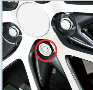
タイヤ・ホイールロック