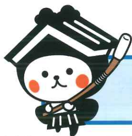
栃木市マスコットキャラクター とち介