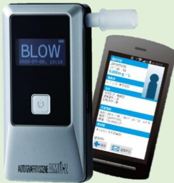
iOS対応 アルコール検知器 AC-018