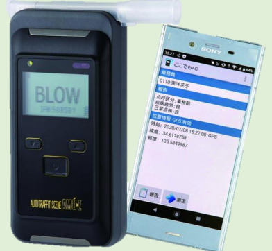
Bluetooth機能付き アルコール検知器 AC-015BT