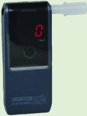
ハンディタイプ アルコール検知器 AC-016